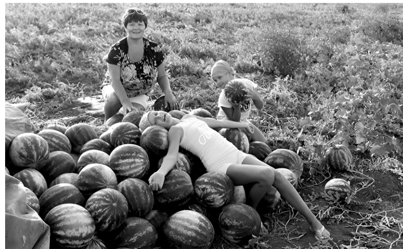
Арбуз — кладесь всего полезного